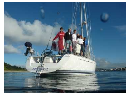
7 So sieht ein perfekter Ankerplatz aus!

12. Endlich hatten wir die Chance bei richtigem Starkwind, aber wenig Welle die Gunvør zu testen. Bei Böen bis zu 45 Knoten ging es richtig ab Richtung Hadersleben. Mit Stagesegel und 2 Reffs lag die Yacht unglaublich gut auf dem Ruder. Mit einem 3. Reff und einem kleineren Sturmstagesegel werden auch 50 – 60 Knoten beherrschbar sein, solange die Welle nicht verrückt spielt. Ein beruhigendes Gefühl zum Ende der Saison.