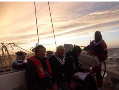
4 Im Sonnenuntergang unterwegs nach England

Außerdem schickte er seinen Bruder vorbei, der sich unbedingt das Schiff anschauen wollte, uns mit Tipps über sämtliche Häfen der Gegend versorgte und noch ein paar T-Shirts von seinem Schiff verschenkte. So herzlich wird man in Irland also empfangen!