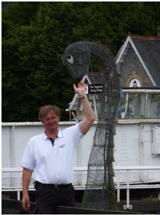
3 Da ist sie - Fotoshooting mit Nessie

Über Loch Ness kreuzte Karsten so viel wie möglich – vielleicht konnte er so ja Nessie heranlocken? Leider stellte sich heraus, dass er bei ca. 30 Knoten Wind mit dem neuen Boot einfach zu schnell für Nessie war – oder lag es am schottischen