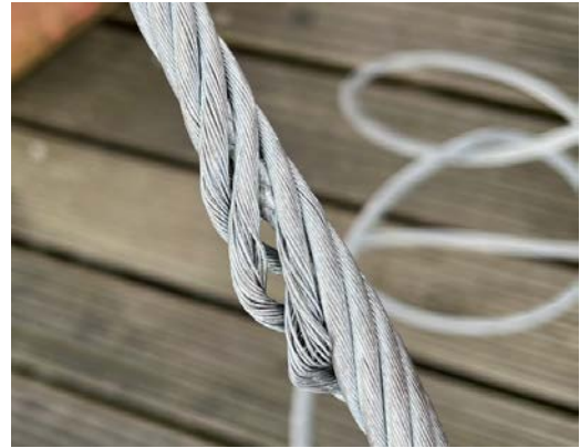
Freitagmittags-Überraschung: kaputt ist kaputt

Am 22. März, einem Freitag, gegen Mittag, erlebten wir eine böse Überraschung. Der Draht am Mastenkran Mitte war an mehreren Stellen durch Kinken und Quetschungen so beschädigt worden, dass wir den Kran sperren mussten. Die Schäden befanden sich etwa in der Mitte des Drahtes, sodass ein kompletter Austausch notwendig wurde. Und wie das so ist mit einem Freitagmittags-Schaden, die Ersatzbeschaffung und Serviceverfügbarkeit verlängern den Ausfall dann gerne mal über das ganze Wochenende. Sehr unschön für die Mitglieder, die sich am Wochenende das Maststellen vorgenommen hatten. Hätte, hätte, hätte man uns doch gleich Bescheid gesagt, wenn solch ein Missgeschick passiert, anstatt klammheimlich den Draht wieder