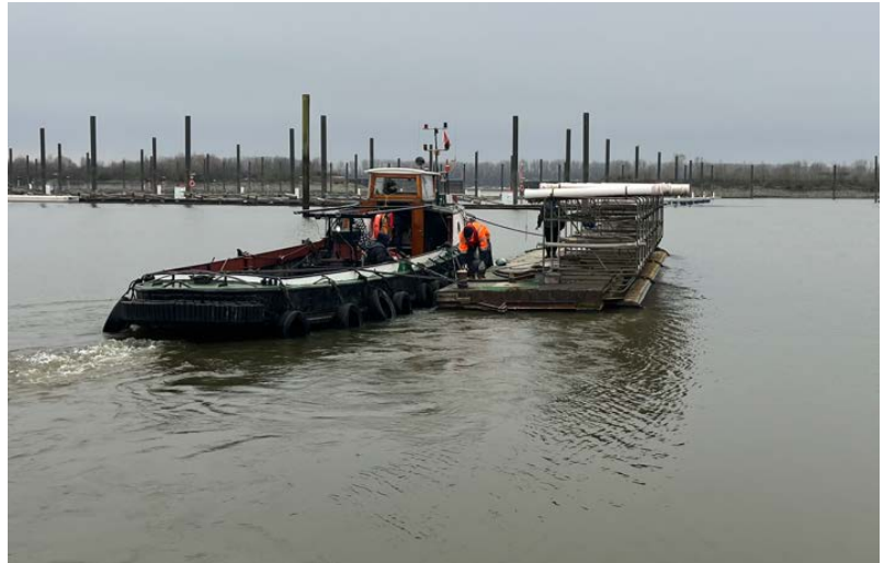
Der alte Ponton mit Optigarage verlässt den Hafen

Die dadurch frei gewordenen alten Kopfschlengel können wir natürlich gut in unserer Anlage verwenden. Der ehemalige Kopfschlengel M rutscht auf J, der dortige Stahlrohrschlengel kann nun der Betriebstechnik als Reparaturponton und Materialponton dienen. Kopfschlengel L soll einmal die Reihe zwischen dem Niedergang West und dem Kran verlängern. In dieser Reihe, direkt neben dem Niedergang, konnten wir außerdem den sehr alten und maroden Ponton durch den