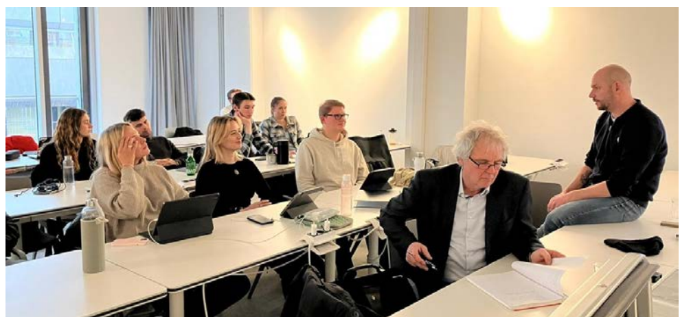
Präsentation der Arbeiten und Diskussion an der HSBA

Studenten auch ganz konkrete und unkompliziert realisierbare Punkte aufzeigten. Vielen Dank für die interessante und wertvolle Zusammenarbeit.